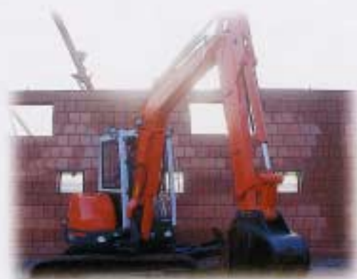
Rendement de terrassement en 10min